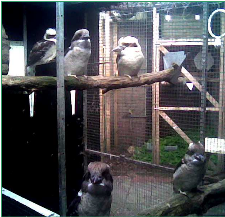
Vader, moeder en 3 jongen

Ik ben nu drie jaar in het bezit van mijn kookaburra's. Ze zitten in een volière van 2 meter breed bij 2 meter lang en 2 meter hoog Ik heb het mannetje los gekocht, dat was even schrikken want op de ring stond dat hij van 1992 was ( een oude man dus ). Het popje heb ik van een kweker gekocht, zij is van 2003. In oktober heb ik ze bij elkaar gezet en vanaf de eerste nacht sliepen ze al tegen elkaar aan. Het klikte meteen! In mei werden er drie eieren gelegd. Kookaburra's broeden vanaf het tweede ei.